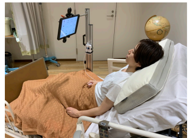
iPadなら持ち運びも簡単・ベッドまわりもすっきり設置

流暢な合成音声を使って話したり、音楽をかけたりメッセージを送ったり、テレビ電話をしたり。カードを1枚選ぶ簡単操作です。