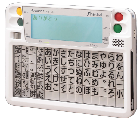
意思伝達装置 ファイン・チャット

ファイン・チャットなら、小さなお子様からご高齢の方まで、誰でもすぐに、コミュニケーションがとれるようになります！