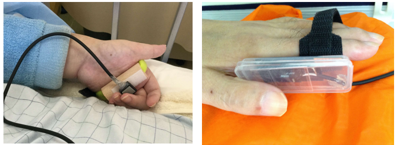
スイッチ適合ホームページ「マイスイッチ」の適合事例

入力スイッチの紹介では、まずは入力スイッチの練習から始めることが出来るように、入力スイッチの種類や疾患、症状別の選定方法、設置方法や練習方法を事例を交えて判りやすくご紹介します。